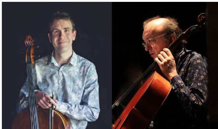
Stéphane Bonneau © Guillaume Heraud / Christophe Roy © Alizée Sarazin

Un pot sera offert à l'issue du concert avec la complicité de l'Amicale La Vie de Château.