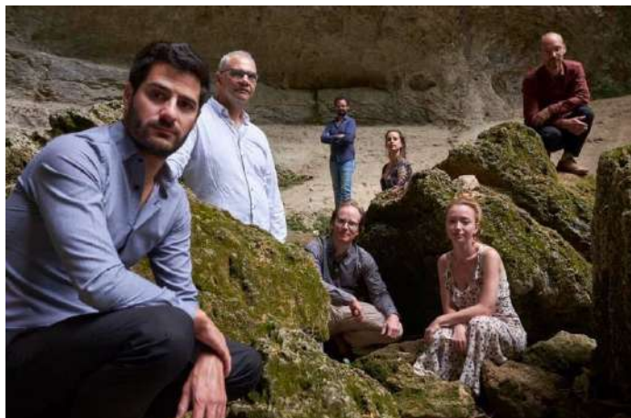
© Ensemble SuperNova – Conservatoire de Chalon sur Saône