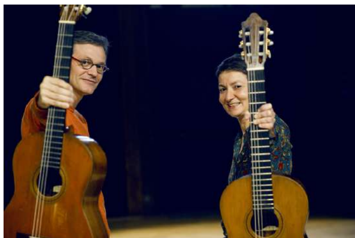
Duo Lallement Marques

Jeudi 7 juillet 2022 / 20h30 / Cour du Musée de Cluny